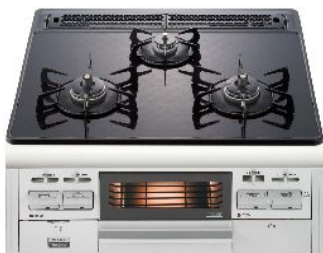
ビルトインコンロ C3WK3RJTSSV(L/R) 希望小売価格 ¥150,150- (税込)