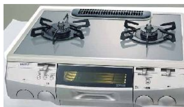
テーブルコンロ W45 希望小売価格 ¥87,900- (税込)